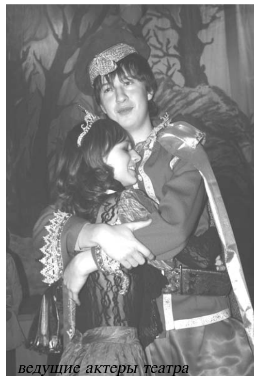
ведущие актеры театра