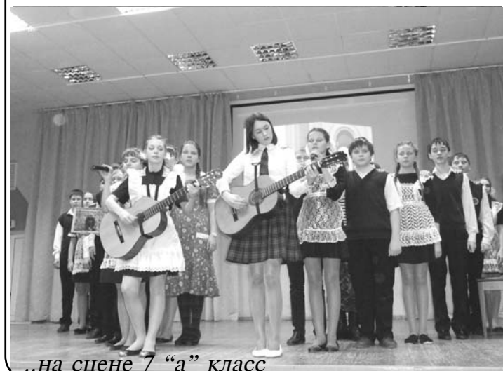
..на сцене 7 "а" класс

Конкурс "Вернисаж талантов", ежегодно проходящий во второй учебной четверти, где каждый класс может заявить о своей индивидуальности тоже стал традиционным. В этом году участникам предстояло погружение на тему "70-летие победы в Великой Отечественной войне", где классы, в дружной и слаженной работе, узнали что-то значимое из событий военных лет и рассказывали об этом другим. Думаю, что это мероприятие никого не оставило равнодушным, ведь это история нашей страны, нашего народа.