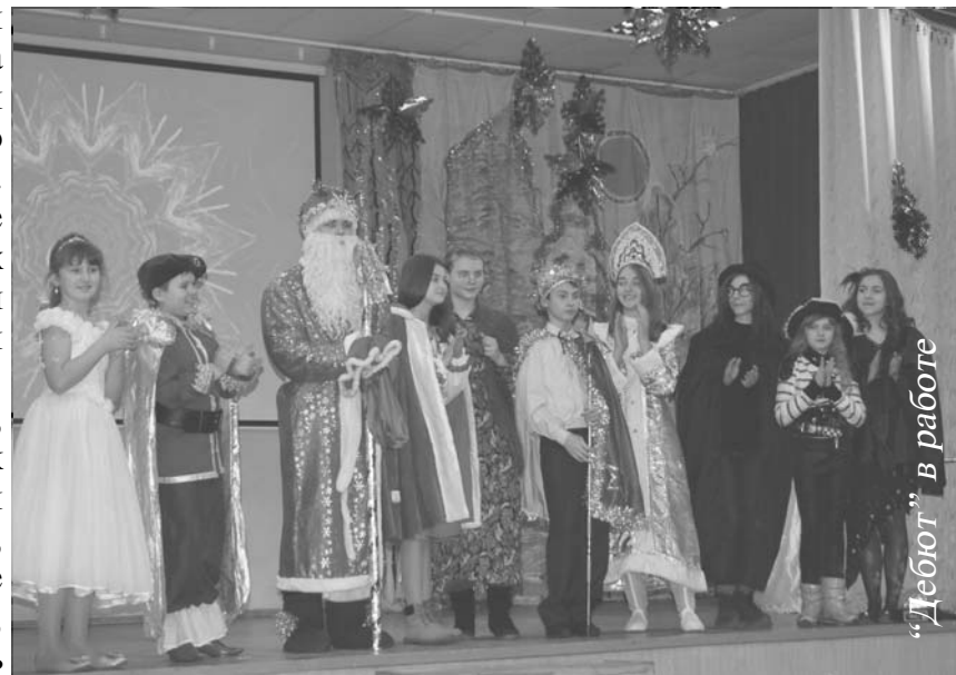
"Дебют" в работе