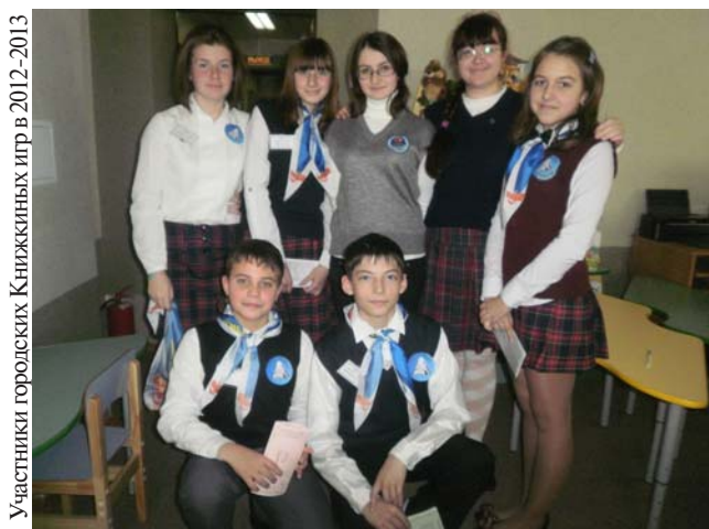
Участники городских Книжкиных игр в 2012-2013

Заканчивается Год Литературы и мы можем подвести некоторые итоги. Начнем с того, что проблему снижения интереса к чтению среди подростков, поднятую президентом Владимиром Путиным, не решить за один год.