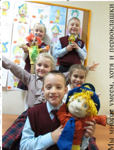
Мы многое умеем, хотя и первоклашки

Как мы нашли Незнайку! Дорогие ребята, к нам в библиотеку вернулся НЕЗНАЙКА, да ни один, а с многочисленными друзьями! И это благодаря нашим трудолюбивым первоклассникам! Все желающие могут посетить выставку - поделку "Наш друг Незнайка" и проголосовать за лучшую работу. Ждем в гости!