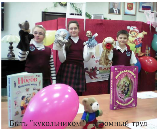
Быть "кукольным" - огромный труд

Итак, в гостях детский кукольный театр "Сказка", которому уже исполнился 1 год! А его слава по школе набирает обороты. Родился этот кружок в школьной библиотеке (по-новому в БИЦ) и его руководителями стали мы, ваши беспокойные библиотекари. Несколько дней в стенах читального зала гремели мини-спектакли по одноименному произведению Н. Носова "Бобик в гостях у Барбоса". Нашими зрителями были первоклассники, которые охотно знакомились с библиотекой и с нами. На следующий день в копилку приветствий добавились "здравствуйте" буквально от всех первоклассников, которые обитают на этаже по соседству с библиотекой. Было приятно: "Нас узнают, помнят!"