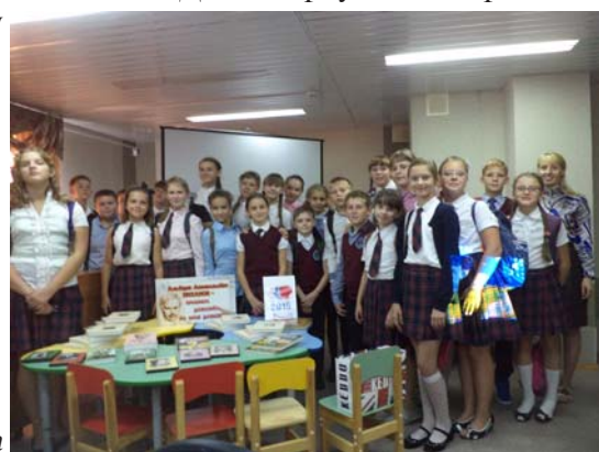
В гостях у Альберта Лиханова